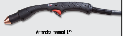
Antorcha manual 15°