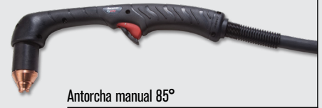
Antorcha manual 85°

Estilos de antorchas robóticas Duramax® Hyamp™ (para ver más opciones de antorchas, visite www.hypertherm.com )